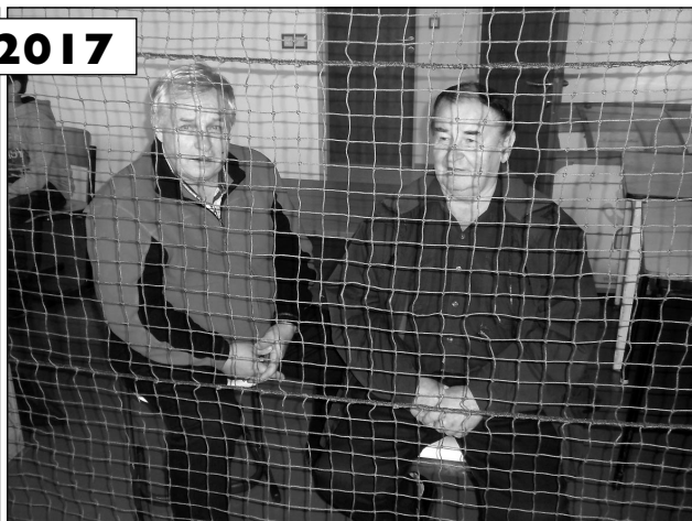
Dobojováno v Obratani po vánocích.