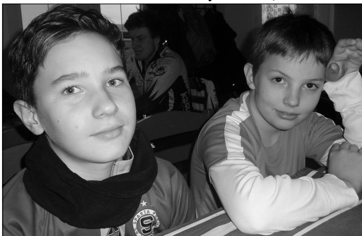
I mladí toho měli dost.