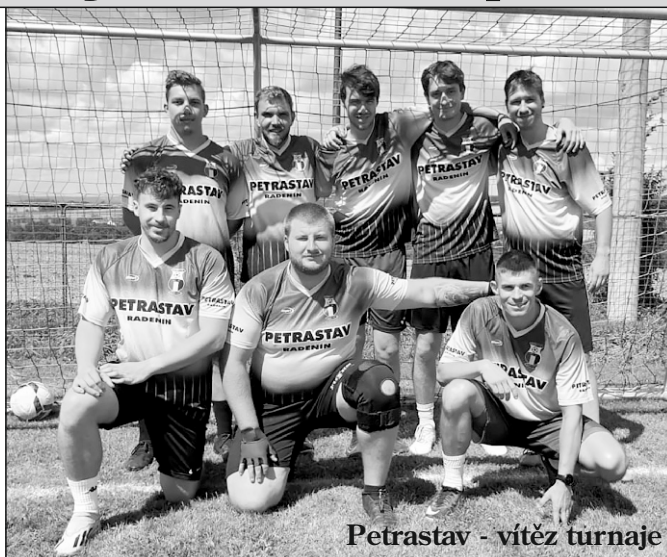
Petrastav - vítěz turnaje

– Aggressive Tyrants, Legalizace Music, Nine Six Nine.