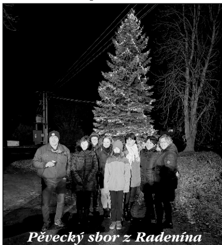
Pěvecký sbor z Radenína

V pátek 29. listopadu 2024 večer se naše vesnice ponořila do sváteční